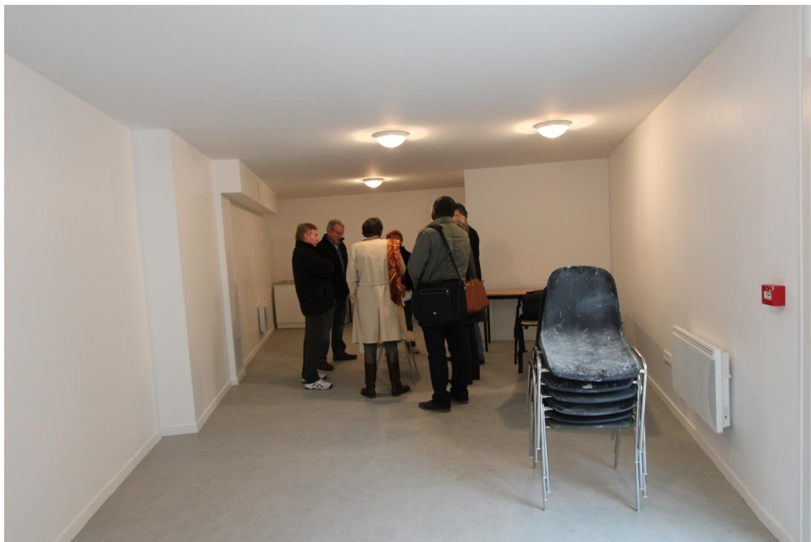
Salle municipale : Bibliothèque

Une convention d'utilisation sera signée avec les associations concernées.